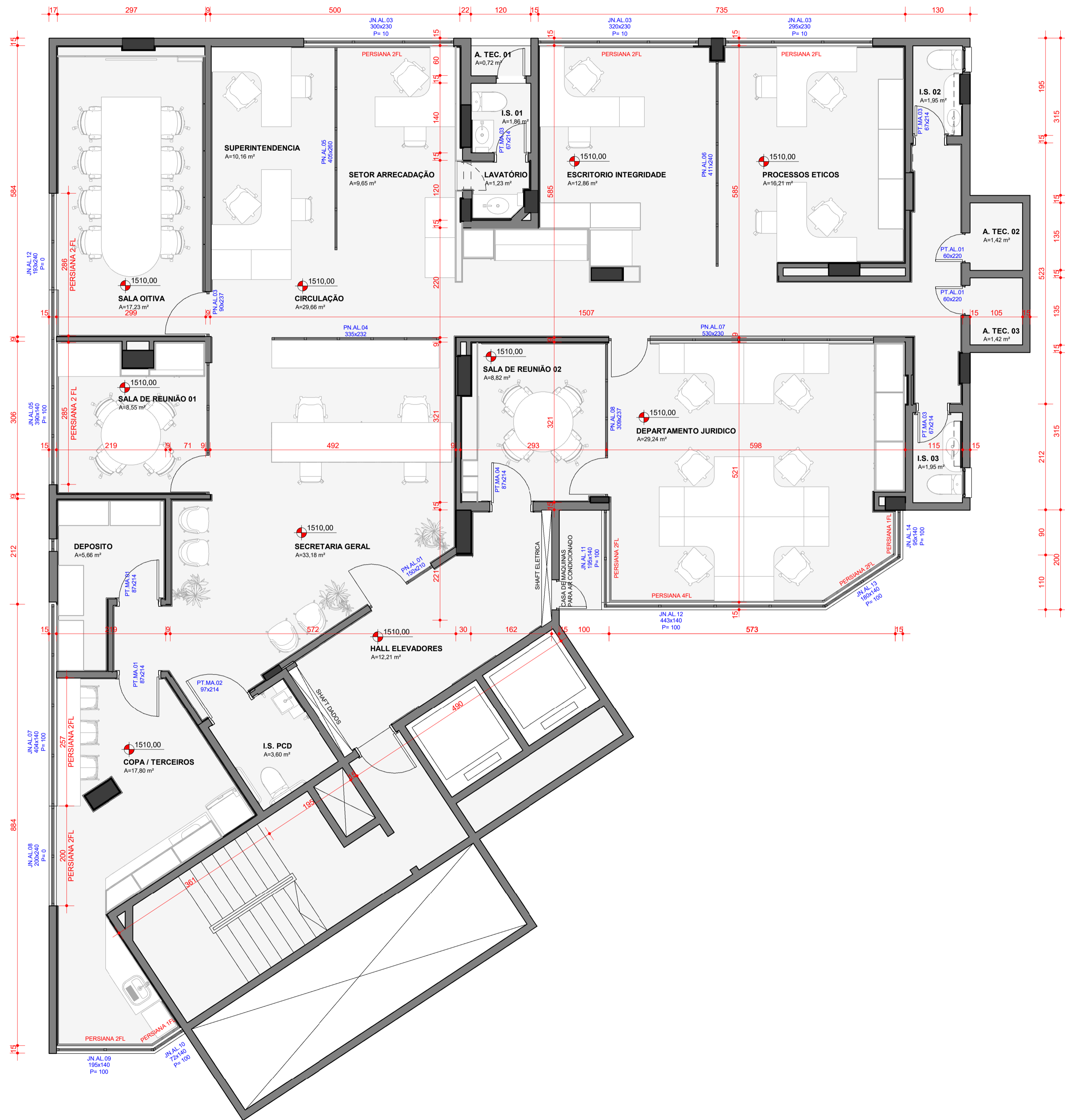
01 PLANTA BAIXA - 5º PAVIMENTO ESCALA 1:50