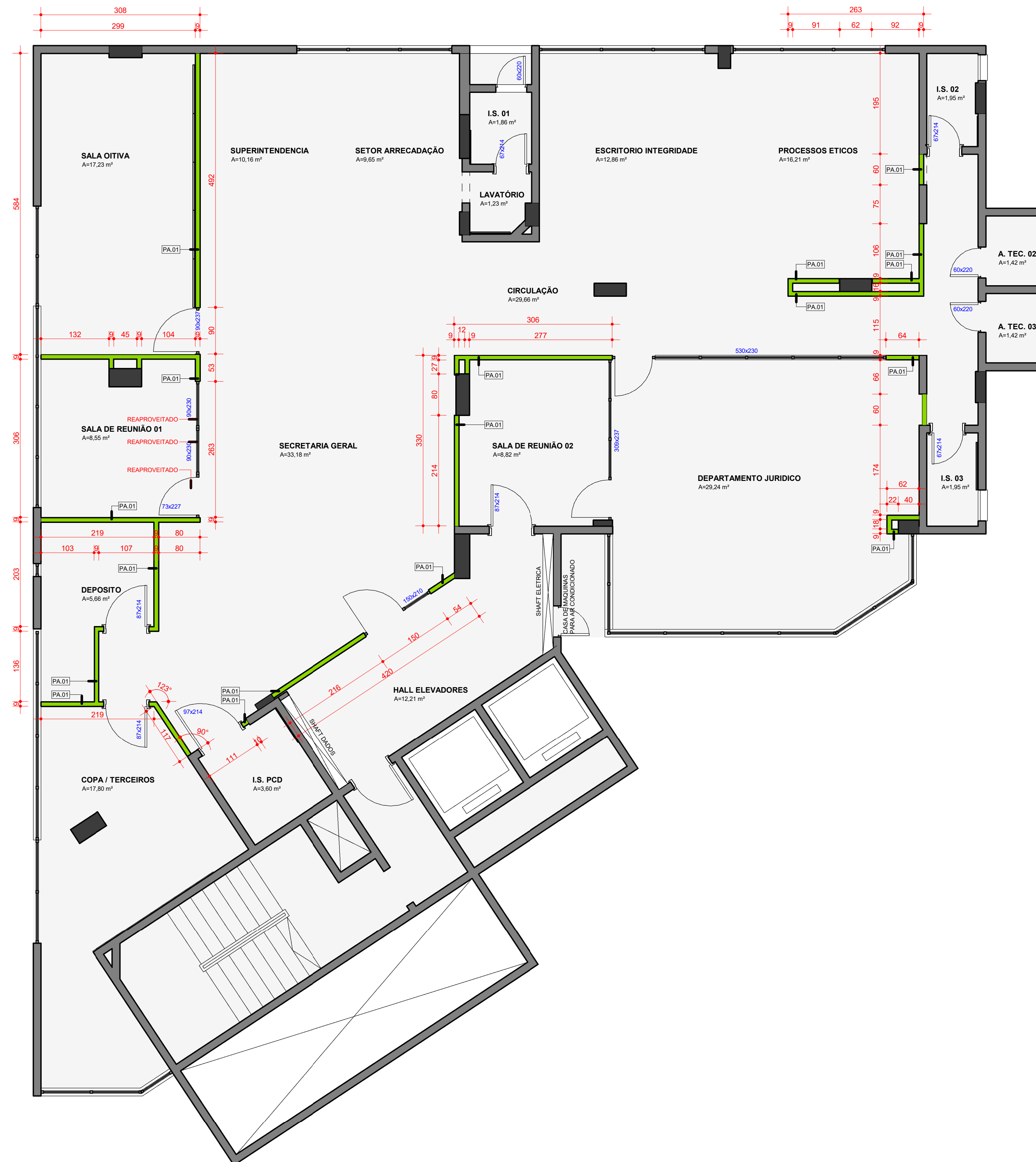
01 PLANTA BAIXA PAREDES - 5º PAVIMENTO ESCALA 1:50